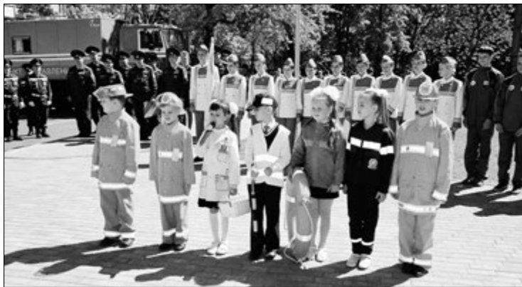
Падчас адкрыцця цэнтру.

У цырымоніі адкрыцця цэнтру ў Віцебску бралі ўдзел прадстаўнікі парламента. Гасцям паказалі пакой, дзе арганізуюцца тэматычныя квесты. У гульнявой форме тут вучаць выклікаць ратавальнікаў, правільна дзейнічаць падчас пажараў у памяшканнях і на двары.