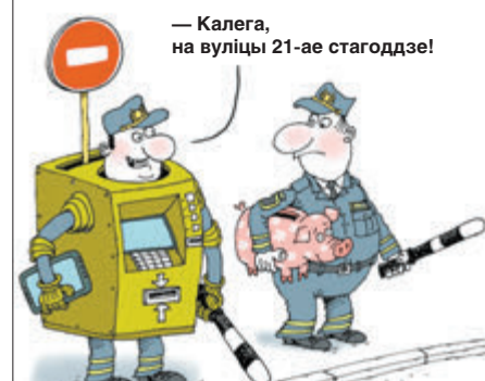
— Калега, на вуліцы 21-ае стагоддзе!