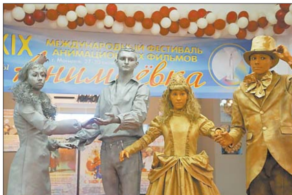
Міжнародны фестываль анімацыйных фільмаў «Анімаеўка-2016» назваў пераможцаў

Тры дні ў Магілёве, Бабруйску і Быхаве панавала атмасфера дзяцінства — у кінатэатрах круцілі мультыкі, адбываліся цікавыя творчыя сустрэчы з вядомымі аніматарамі, праходзілі прэзентацыі, выставы і майстар-класы.