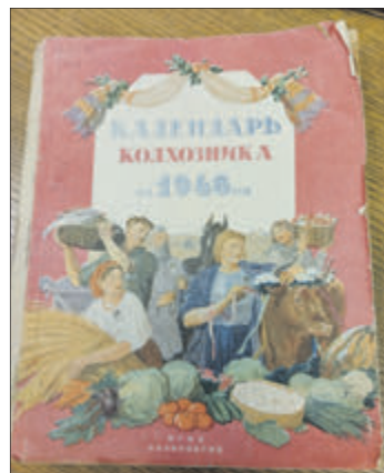
Знакаміты «Каляндар калгасніка», які карыстаўся попыткам па ўсім Савецкім Саюзе.

Каб адказаць на гэта пытанне, адпраўляемся ў аддзел старадрукаў і рэдкіх кніг Прэзідэнцкай бібліятэкі Рэспублікі Беларусь. Фонды аддзела — больш за 70 тысяч адзінак унікальных выданняў, самае старажытнае з якіх датуецца 1537 годам (выданне на лацінскай мове па праве).