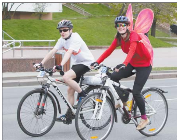
Карэспандэнт «Звязды» таксама паўдзельнічала ў адкрыцці сезона.

У апошні дзень красавіка на праспекце Пераможцаў прайшло самае масавае ў гісторыі адкрыццё веласезона. Удзел у свяце прынялі не толькі тысячы велаамаў з розных рэгіёнаў Беларусі, але і знакамітыя беларускія спартсмены, а таксама службоўцы. Да грандыёзнага веларадыя дачучыся са сваім двухколавым сябрам і карэспандэнт «Звязды».