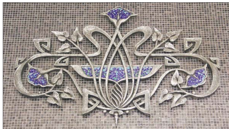
Адноўлены дэкаратыўны металічны элемент.

— Мірскі замак, работы на якім былі распачаты яшчэ ў 1984 годзе. Паспяхова здалі яго мы ў 2010 годзе. За гэты аб'ект нават атрымалі граматы як найлепшае рэстаўрацыйнае прадпрыемства ў Беларусі. Ад аднаўлення сцен і цаглянай кладкі і да інтэр'ераў — над усім шчыравалі нашы спецыялісты. Толькі некаторыя прадметы мэблі рабілі на беларускіх прадпрыемствах, у прыватнасці на