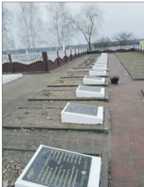
Магільныя пліты з прозвішчамі загінулых.

Сваякі звычайна прывозілі з сабой нейкія рэчы: дакументы, пісьмы, сувеніры. Так вось спачатку стыхійна, а потым свядома стаў фарміравацца музей. Пявіўся піянерскі пошукавы клуб «Гвардзеец». І ўжо ў пачатку 70-х гадоў сталі праводзіць вахты памяці. Ёсць нават запіс перадачы, якую ў 1972 годзе пра Шылінскую школу здымала Брэсцкае тэлебачанне, там расказвалася пра ганаровую вахту. Музей папаўняўся новымі экспанатамі, перапіска працягвалася, экспазіцыя расла. А калі школу ў вёсцы