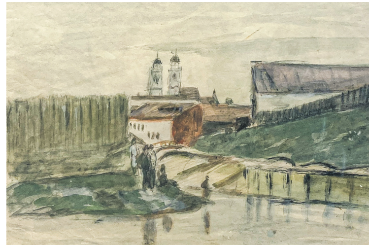
«Мінск», 1928 г.

Дынамічныя лініі, ненапружаныя формы, лаканізм дэталей — нешматлікія інструменты мастака, даволі стрыманага, схільнага да прастаты. Дарэчы, і ў малюнках алоўкам, якіх у экспазіцыі даволі шмат, адсутнічаюць асаблівыя націскі і штрыхавыя акцэнты.