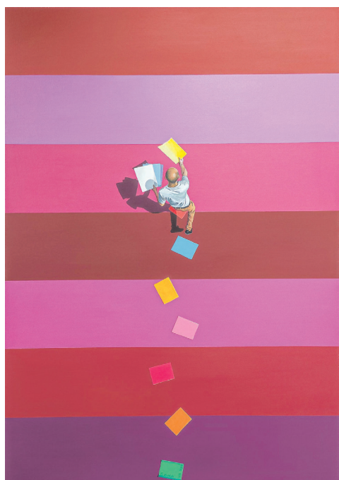
Фёдар Бажын «Шлях артыста», 2022 г.