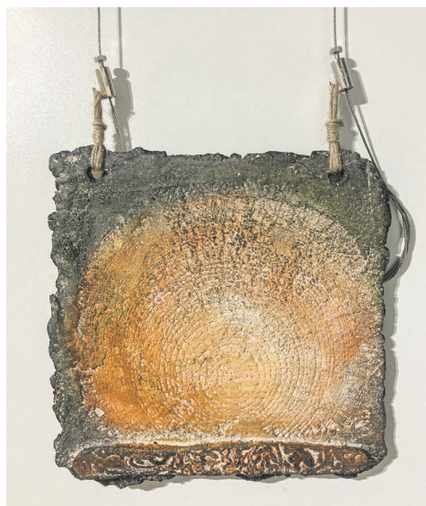
Леанід Рыжкоўскі «Летазлічэнне», 2022 г.

Іван Іванавіч таксама звярнуў увагу на тое, што асноўнымі застаюцца традыцыйныя кірункі народных мастацкіх рамёстваў, аднак разам з тым ствараюцца ўмовы для развіцця і папулярызацыі сучасных відаў дэкаратыўна-прыкладнага мастацтва. Прадстаўнік Міністэрства