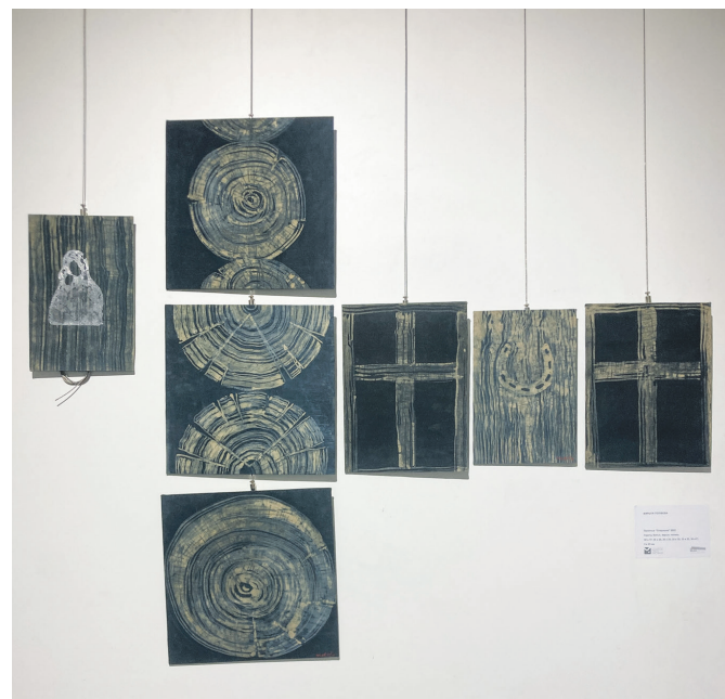
Марыта Голубева «Спадчына», 2022 г.

— Адзін з тэкстыльных праектаў — выстаўка міні-тэкстылю, якую мы праводзім другі раз, — расказала мастак па тэкстылі, старшыня секцыі тэкстылю Беларускага саюза мастакоў Вольга Рэднікіна. — Так, прадстаўляем работы ў розных матэрыялах і тэхніках, абмежаваныя па памеры: 20 на 20 ці 30 на 30 сантыметраў. Такі памер дазваляе мастаку хутка апрабаваць новыя матэрыялы і ўвасобіць сваю ідэю. Калі разважалі пра тэму выстаўкі, палічылі, што будзе цікава паказаць тэкстыль праз сінтэз абсалютна розных тэхнік і матэрыялаў. Работы нашых удзельнікаў зроблены з выкарыстаннем шкла,