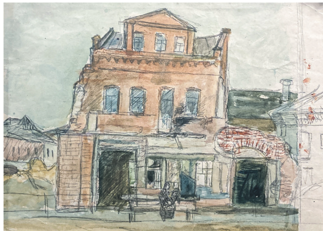
«Чырвоны дом у Мінску», 1928 г.

Мінск пачатку мінулага стагоддзя — якім ён бачыўся тагачасным мастакам? Іх творы — не толькі яркая частка айчыннага мастацтва, але і старонка гісторыі: усё ж аблічча горада вельмі змянілася за апошнія 100 гадоў. Атмасферу сталіцы Беларусі перыяду магутных зрухаў здолелі перадаць нямногія мастакі, у іх ліку — Меер Аксельрод, 120-годдзе якога адзначаецца сёлета.