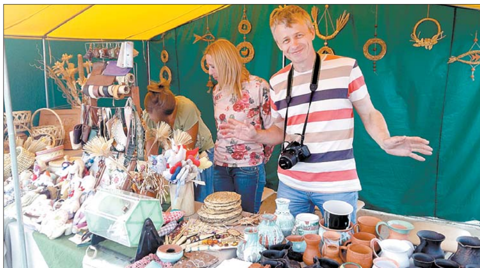
Мастоўскі цэнтр рамёстваў пастаянна ўдзельнічае ў раённых, абласных, рэспубліканскіх выставах, кірмашах і святах.