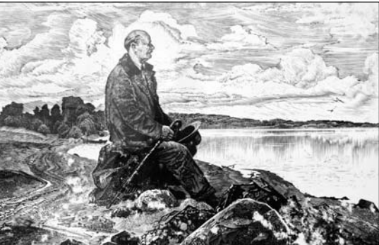
Васіль Ткачук. «Якуб Колас». Папера, літаграфія. (Работа перададзена сёлета ўнучкай мастака ў падарунак Коласаўскаму музею.)

— Кожны з нашых «Каласавін» пакідаюць свой след у даследаванні творчай спадчыны народнага паэта, — кажа дырэктар літаратурна-мемарыяльнага музея Якуба Коласа Зінаіда КАМАРОЎСКАЯ. — Здавалася б, што можна новага знаходзіць на працягу трох дзесяцігоддзяў такой вялікай колькасці даследчыкаў! Аказваецца, можна. Творчасць Коласа, яго жыццёвая дарога невычарпальныя, у іх адкрываюцца ўсё новыя і новыя штрыхі, факты, рысы. Сімвалічна, што кожныя «Каласавіны» як магнітам