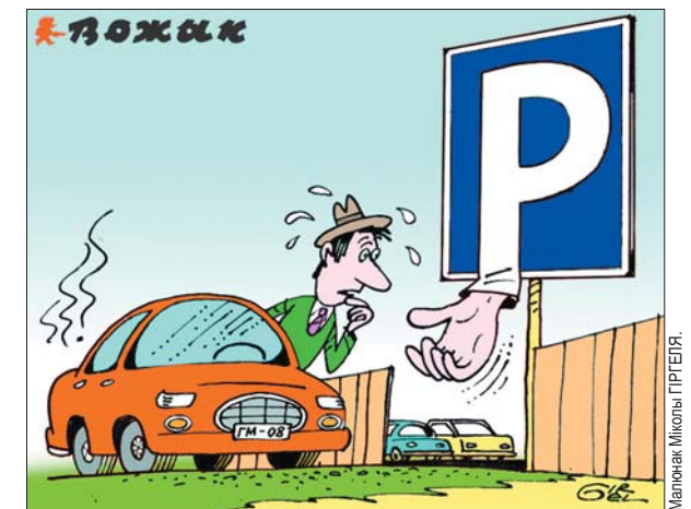
Малюнак Міколы ГРЭПЕЯ.

Для таго каб стаць жонкай мільярдэра... Трэба выйсці замуж за мільянера. Ды дваццаць гадоў паматацца з ім па Мальдывах ды Сен-Трапэ.