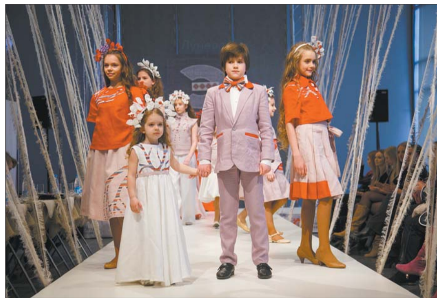
Дзіцячае адзенне з апликацый галінак і каранёў дрэў.