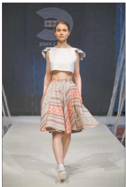
Стыльная «ручніковая» спадніца.