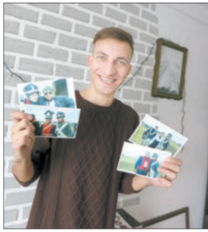
На памяць аб «Уланскай баладзе» засталася шмат здымкаў з зоркамі кіно.