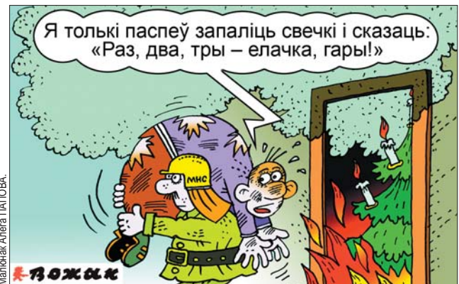
Малюнак Алены ПЛАТОВА.

— Ты аліўе будзеш? — Не. — Тады я ў ім буду спаць.