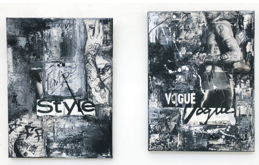
Калажы Ірыны Сафронавай, 2021 г.

рысачкі ды кропачкі ствараліся ўвядзеннем у загадка праробленыя парэзы драўнянага вугалю. Такіх малюнкаў на целе далёкага прашчур, зноў жа калі верыць інфармацыйным шчытам, было каля 15.