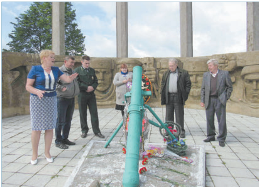
На «Ціхмянаўскай вышыні».

Наш карэспандэнт прыняў удзел у выязной сесіі Лёзненскага раённага Савета дэпутатаў. У цэнтры ўвагі была тэма добраўпарадкавання.