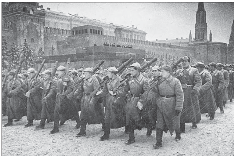
Адрозу пасля парада чырвонаармейцы адправіліся на фронт.