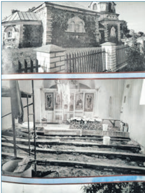
Унутры храма пасля таго, як над царквой быў учынены гвалт.