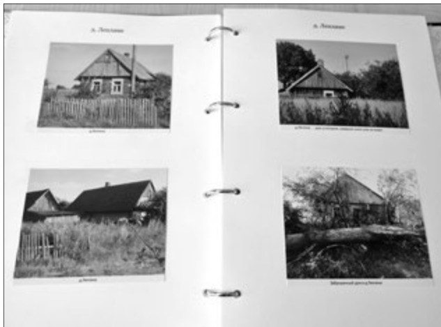
Аляксандр Канавалаў зрабіў альбом, прысвечаны мастаку і мясцінам, з ім звязаным.

Пасля падарожніка стаў аб'язджаць мясціны, звязаныя з гістарычнымі падзеямі ці вядомымі асобамі.