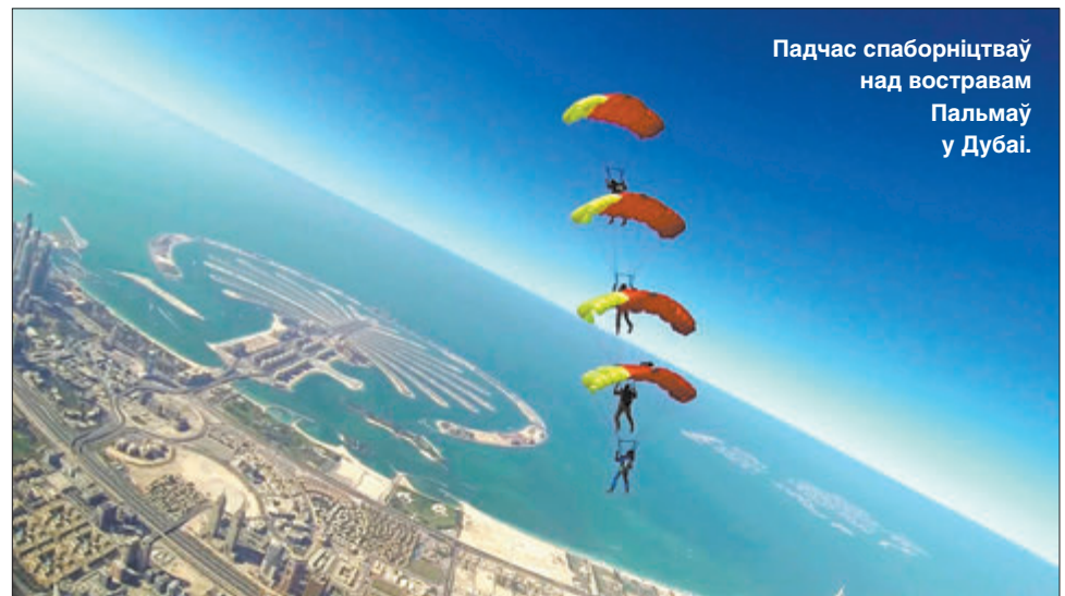
Падчас спаборніцтваў над востравам Пальмаў у Дубаі.