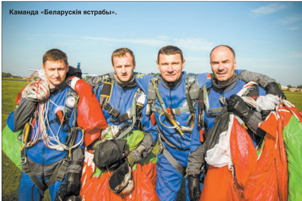
Каманда «Беларускія ястрабы».

ны парашут. У нашым відзе настолькі вялікая асабістая хуткасць парашута, што прыбор можа сам аўтаматычна спрацаваць.