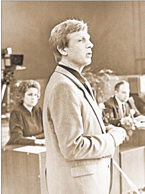
Падчас канферэнцыі ў Брэсце, пачатак 1990-х.