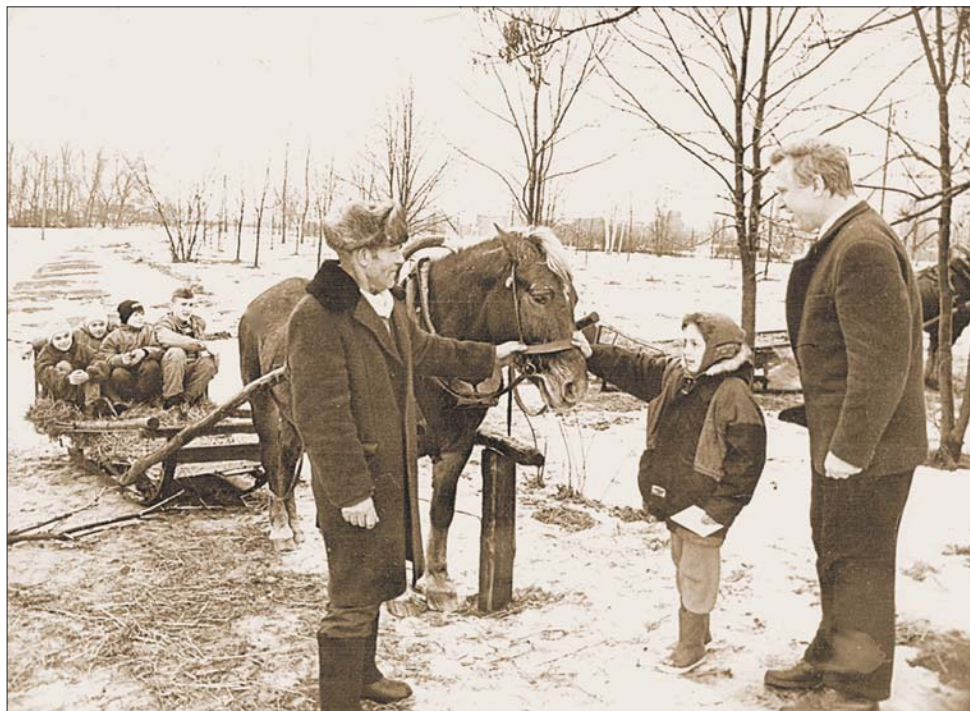
У вёсцы Палессе Чачэрскага раёна, студзень 1997 года.