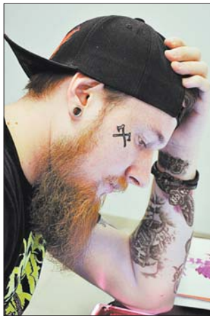
Скрыжаваныя сякеры — спрощаны варыянт родавага герба.

— Першую зрабіў ад гадоў таму і доўга хаваў ад бацькоў — баяўся, што будуць сварыцца. Калі маці яе ўсё ж