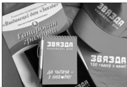
Узнагароды і сувеніры пераможцам.