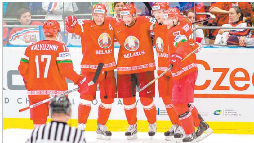
Склад зборнай Беларусі:

У Санкт-Пецярбургу матчы чэмпіяната свету па хакеі пройдуць другі раз. Паўночная сталіца Расіі чакала гонару прыняць самыя моцныя хакейныя зборныя свету аж 16 гадоў. Піцэрская частка спаборніцтваў пройдзе ў гістарычным спарткомплексе «Юбілейны», які ўжо прымаў чэмпіят свету ў 2000 годзе. У горад на Няве прыехалі дзеючыя чэмпіёны свету — канадцы, гранды — фіны і амерыканцы, сярэднячкі — беларусы, немцы і французы, ну і, мабыць, самыя непрыкметныя ў нашай групе — венгры.