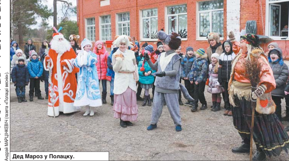
Дед Мороз у Полацку.

Ужо больш за 700 чалавек з Беларусі, Расіі, Латвіі пабывалі ў рэзідэнцыі полацкага Дзеда Мароза.