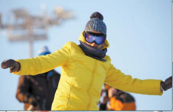
У мінулыя выхадныя ў горналыжным цэнтры «Сілічы» адбылося адкрыццё асноўнай спускавай трасы.