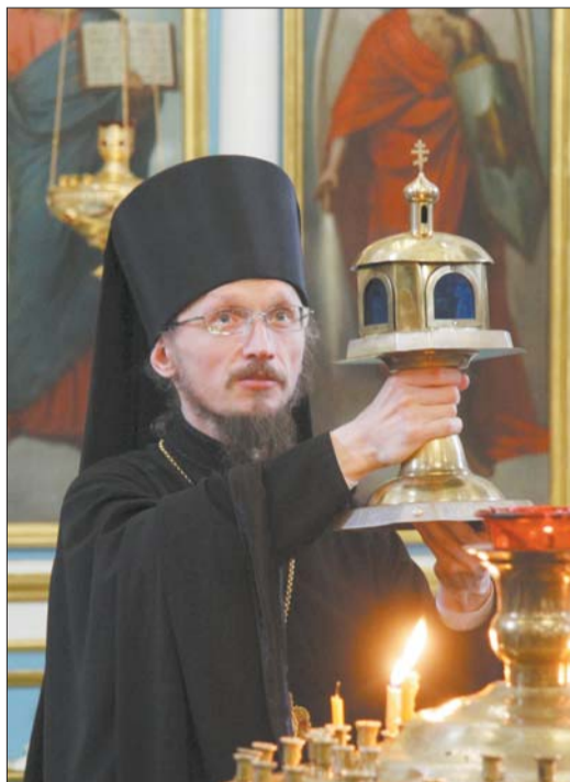
— У свой час вы атрымалі тэхнічную адукацыю і адпаведную спецыяльнасць.

Чытачы «Звязды» вось ужо больш за дваццаць гадоў сочаць за міжнароднай навукова-асветніцкай экспедыцыяй «Дарога да святыхняў».