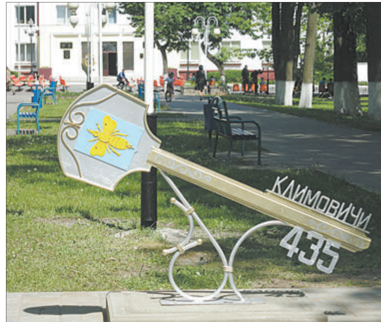
Міжнародны фестываль «Залатая пчолка» карыстаецца попытам у расіянаў.

Завязанню новых стасункаў спрыяе і наш міжнародны фестываль дзіцячай творчасці «Залатая пчолка». Расія прадстаўлена на ім вельмі шырока — ад Калінінграда да Далёкага Усходу. У нас пабывалі прадстаўнікі амаль усіх абласцей Расіі. У складзе дэлегацыі прыязджаюць і дыпламаты. Гэтым разам упершыню запрасілі прадстаўнікоў маладзёжнага парламента. Юнакі і дзяўчаты абедзвюх краін сядуць за круглы стол і складуць спіс агульных спраў. Так што супрацоўніцтва працягваецца.