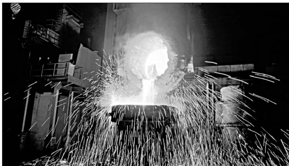
Производство металлургической промышленности — один из шести типов товаров, вошедших в перечень наиболее востребованных в Республике Казахстан.