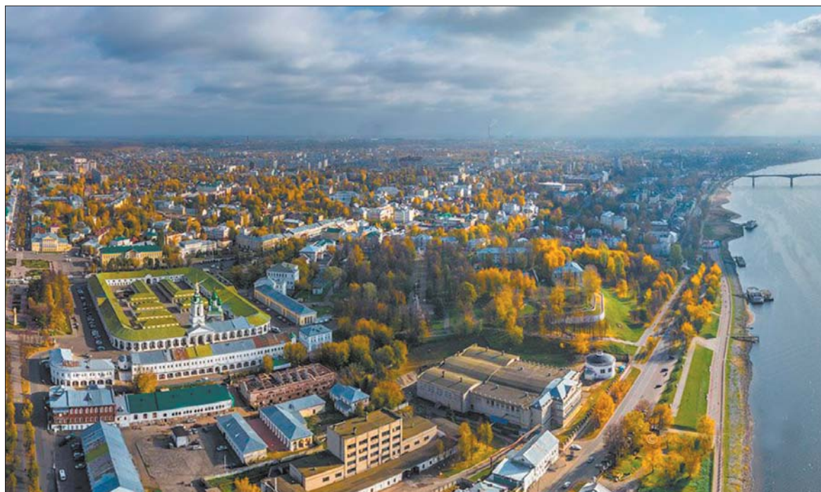
Кострома — старинный российский город, входит в «Золотое кольцо России».