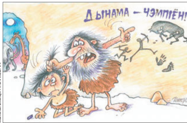
Малюнак Віленцы ПУЗАНКЕВІЧА.

Сёння сам прыбраўся ў кватэры! Хай цяпер жонка паспрабуе знайсці свае калготкі!