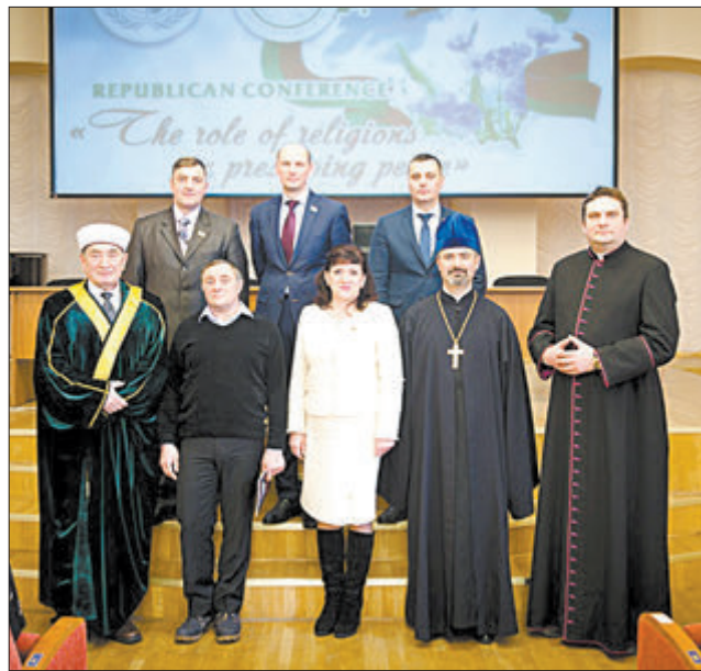
Удзельнікі канферэнцыі «Роля рэлігіі ў захаванні міру» у Полацкім дзяржаўным універсітэце.