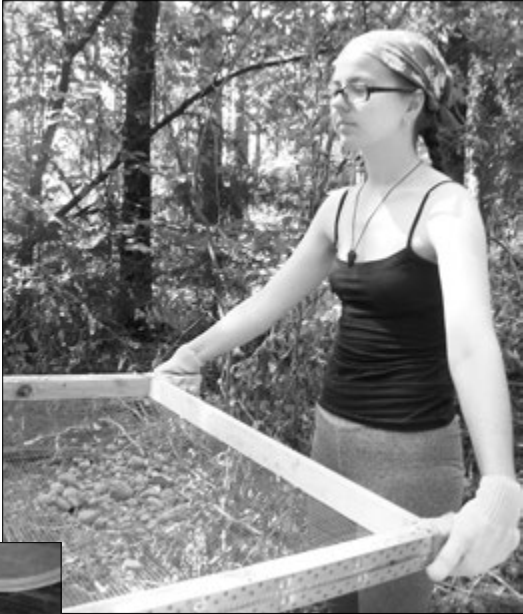
За дзень даводзіцца перавярнуць тony пяску.

Дагэтуль вучоныя ніяк не маглі сысціся ў меркаванні, дзе ўсё ж такі адбылася гістарычная бітва, датаваная 984 годам, паміж войскам Уладзіміра Чырвонае Сонейка на чале з ваяводам па мянушцы Воўчы хвост і радзімічамі, апісаная летапісам Нестарам у «Аповесці мінулых гадоў». Бо рэчка Пясчанка, якую згадвае ста-