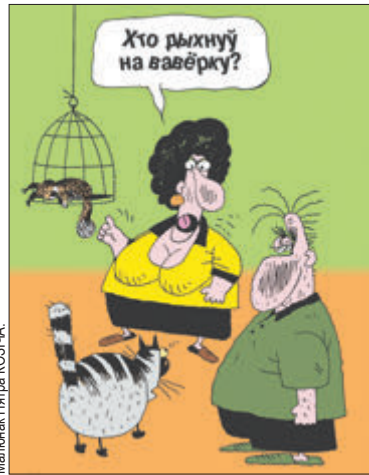
Малюнак Тітра Козіча.

У рэстаране афіцыянт звяртаецца да наведвальніка: