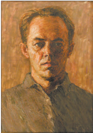
Віктар Аляксандравіч ГРАМЫКА. Аўтапартрэт. 1965—1966. Кардон, алей.

пацямнелы ад гора твар з горка сцятымі вуснамі — яна нібыта скамянела ў роспачы. Старая сядзіць на каленях, і, калі пільна прыгледзецца, выява беларускай сялянкі і байца нагадвае сцэну Петы. Побач — дзявочая фігурка. Дзяўчына-падлетак крычыць. Але гэта не жалобнае галашэнне. Рух складзеных