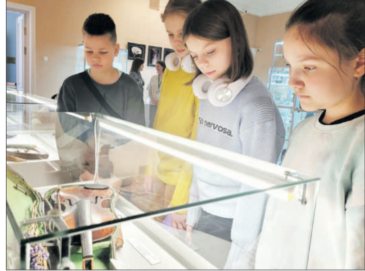
паркавага ансамбля Вольга ГВОЗДЗЬ.

Можна пабачыць рарытэтную газавую лямпу: з металу і практычна цалкам са шкла. Цікава раскрываецца тэма адбіткаў часу на розных рэчах з фарфору.