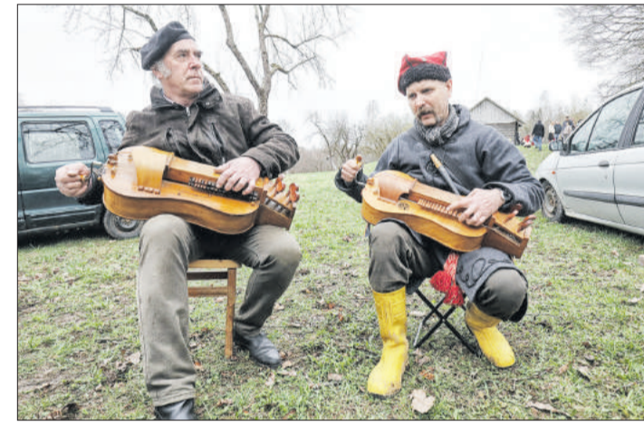
кі-Янкі», « Крыжачка » і іншых народна-брэндавых танцаў. Чарку на пасажок ніто нікому афіцыйна не прапаноўваў, але жа для абрадавага падобства гасціннага спадарыня музыкам-валачобнікам наліваў з глінянага гарлячкіка нейкі добры напой, і закусіць давала каўбасой «пальчанка пханай». На кірмашы стаялі чэргі за пацастункам, чаем, кавай. Мёд ад вясковых пчол (так рэкламаваў свой тавар адзін з пчалярюў, быццам бы існуюць гарадскія пчолы), гарбата на зёлках, майстар-клас па вырабе сыру з дэгустацыяй — і хлеба, і відо-вішчаў хапала ўсім. Звычайна сумныя рамеснікі страпануліся, бо людзі падыходзілі да іх вышыванак, кубачкаў, саламяных і драўляных вырабаў і пераклупналі шыропажыву і нават бралі штодзі. Напрыклад, хітом прадстоіць сталі гліняныя свістулькі, якімі ў асноў-

Запозная вясна знешне нагадвае геранію « Службовага рамана » Людмілу Пракопаўну (Мымру) , якой прыгажосць і жаночы шарм былі непатрэбныя. Шэрую непрыкметнасць дзелавой дэмы перамагло каханне. Вясну-красну беларусы гукаюць і зазываюць ад зімовай Масленіцы на асфальтавых пляцоўках, вясковых падворках і гістарычных лакацыях, водзачы карагоды і спяваючы гучныя песні. Прычым выкананне, пранікнёнае высокімі пачуццямі, у народнікаў-фалькларыстаў не горшае, чым ва ўзронага хору абласнога ўзроўню. Аднак вясна нешта марудзіць (можа, цану набірае, як усе прыгажуні) і не спяшаецца расцвітаць усімі сваімі фарбамі.