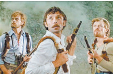
«Зямля Саннікава» «Беларусь 3», 12 лістапада

Схаваную сярод арктычных льдоў зямлю многія лічылі міфам. Палітычны ссыльны Ільін у кампаніі некалькіх авантурыстаў пры фінансавай падтрымцы багатага прамыслоўца знайшоў гэты загадкавы край, аднак высветлілася, што той неўзабаве будзе знішчаны землятрусам. Ці ўдасца экспедыцыі дасягнуць мацерыка і папярэдзіць катастрофу?..