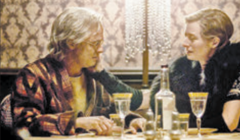
«Загадкавая гісторыя Бенджаміна Батана» TV1000, 13—14 і 17 лістапада