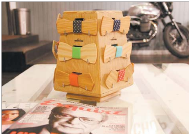
Драўляныя гальштукі-матылькі цяпер у модзе.