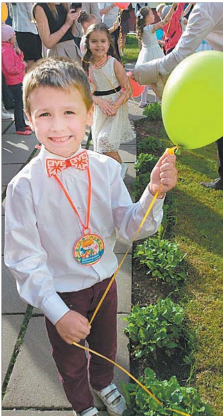
Апошнім часам бацькі ўсё часцей набываюць сваім дзецям матылёкі з арнамантам.

«У ідэале матылёку, як і звычайных гальштукаў, павінна быць некалькі, — лічыць Вераніка. — Кожны для сваёй нагоды».