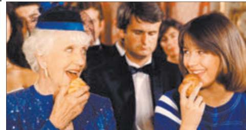
«Двое ў новым доме» «Беларусь 3», 2 снежня

Юная французжанка Вік пераходзіць у новую школу, заводзіць новых сяброў і перажывае ўсе стадыі першага падлеткавага кахання: танцы, спатканні, пацалункі, сваркі і прымірэнні... У 90-я гады прыгоды Вік, яе сяброўкі Пенелопы, прабабулі Пулет і ўсіх астатніх разняволена-рамантычных французцаў вокамгненна сталі кінахітом, а загалюная музычная тэма разы-шлася па свеце ў колькасці 8 мільянаў копіяў. Сёння, канешне, падзеі фільма выглядаюць найўнай меладрамай — асабліва калі ўспомніць, што Сафі Марсо ўжо 52 гады.