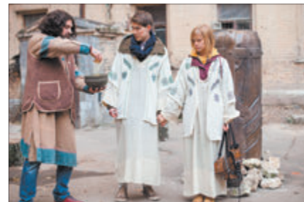
«Саша + Даша + Глаша» «Беларусь 1», 26 лістапада