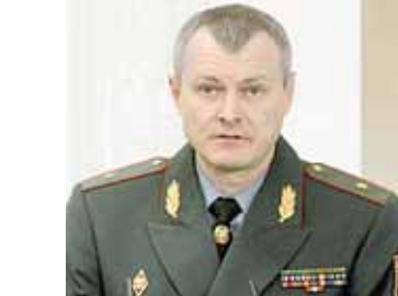
Ягар ШУНЕВІЧ, міністр унутраных спраў:

«Сёння склаўся на рэдкасць унікальная сітуацыя, калі паміж ведамствамі ў сілавом блоку няма абсалютна ніякіх супярэчнасцяў. Ёсць здаровая канкурэнцыя, але яна рабочая і заснаваная толькі на жаданні больш якасна выканаць сваю працу. Не б'юцца за тое. Іншай формы такой канкурэнцыя не была, і я спадзяюся, у будучыні гэтага не здарыцца. Ні адно з ведамстваў не займаецца перацягваннем коўдры на свой бок. Я прыхільнік таго, каб кожны займаўся сваёй справай і не лез у агарод іншага. Каарынацыя ўжо прысутнічае. Мы будзем яе адліфіраваць і даводзіць да дасканаласці». Курсы замежных валют, устаноўленыя НБ РБ з 06.08.2013 г. Долар ЗША 8890,00 Еўра 11810,00 Рас. руб. 270,50 Укр. грыўня 1091,80