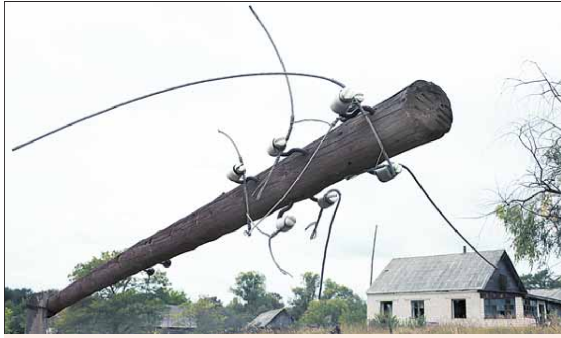
Пакінутая вёска Краснаселле — адзін з сімвалаў смутку чарнобыльскай зямлі.

Наведаць 30-кіламетровую зону адчужэння — гэта значыць пабыць у самым сэрцы самага запаведнага беларускага запаведніка. І гэта не таўталогія. Сюды можна трапіць толькі па асаблівым дазvole, прайшоўшы некалькі інстанцый прапускнога рэжыму і мінуўшы два кантрольна-прапускныя пункты. Нават супрацоўнікі з складу абслуговага персаналу не маюць права наведаць тэрыторыю ў нерабочы час. Запаведная асаблівасць зоны адчужэння незвычайная і нават здзіўная — абараняць чалавека ад прыроды. На жаль, ад прыроды, забруджанай выкідамі з узарванай Чарнобыльскай АЭС. Уся ахоўная тэрыторыя літаральна «ўпрыгожана» папераджальнымі паказальнікамі, знакамі і шыльдамі: асцярожна — радыяцыйная небяспека!