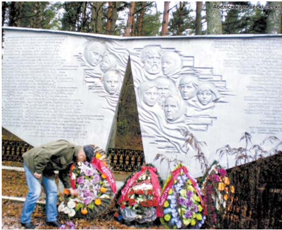
Абеліск каля вёскі Лескі.