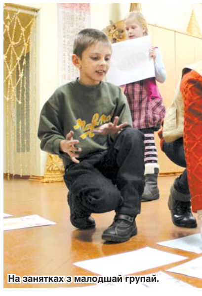
На занятках з малодшай групай.

— Для таго, каб стаць свабодным. Увогуле, ёсць два сродкі малывання: мозг і рука. Тыя, хто «малюе мозгам», дзейнічаюць няправільна, бо яны кантраляюць сябе. Гэта тыя самыя дарослыя, якія ўвесь час думаюць, што ім трэба зрабіць і што намалюваць, «закоўваюць» сябе ў пэўныя рамкі. Ідзе пастаянны аналітычны працэс мыслення. Яны не свабодныя і не адпускаюць сябе. Яны маюць сабе, якія ўжо бачылі, узаўважваюць тое, што ім вядома, не ствараючы штосьці новае. Людзі, якія «малююць рукой», зусім свабодныя, яны «адключаюць» галаву. Мне больш блізка апошні метад, калі ты «выключаешся» і выплываеш на паперу ўсё, што ў табе ёсць. Гэта будзе не штосьці навязанае іншым светам і людзьмі, а выключана тваё, тое, што звычайна не паказваеш. А пасля, па-