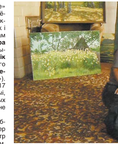
Кадр з фільма Вольгі Дашук «Не адзін».

Уласна героі ў Каці Махавай атрымаюцца вельмі сымпатычныя. Такі просты і добры вясковы хлопец, шчыры, трохку сарамлівы і вельмі працавіты. Увесь час даводзіцца бачыць сучасных гарадскіх дзяцей, якія суткамі «завісаюць» калі камп'ютара і не адрываюцца ад экрану смартфоннага ў мёрт. А тут — такія жывыя, «аўтэнтчныя»