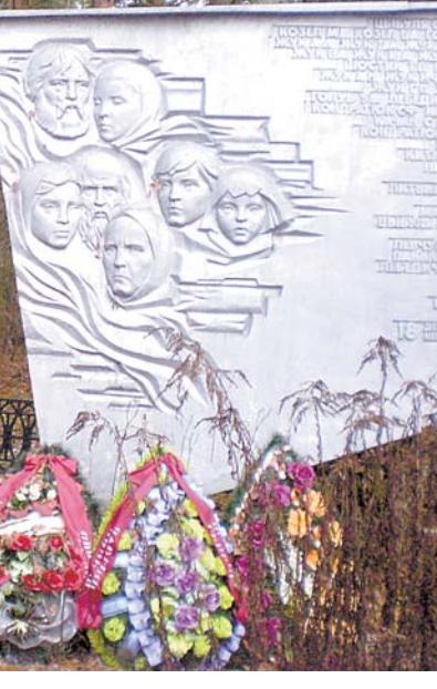
Абеліск ля вёскі Лескі Камянецкага раёна.

Гэта зусім недалёка ад Бреста, паміж вёскамі Радванічы і Франапаль, пры Польшчы тут знаходзілася сядзіба мясцовага лясніцтва Івана Гаўрылюка. Пра тое, што былі ляснічы з першых дзён вайны дапамагалі партызанам, месцічы даведліся толькі пасля таго, як яго, жонку і малаго сына па-зверску