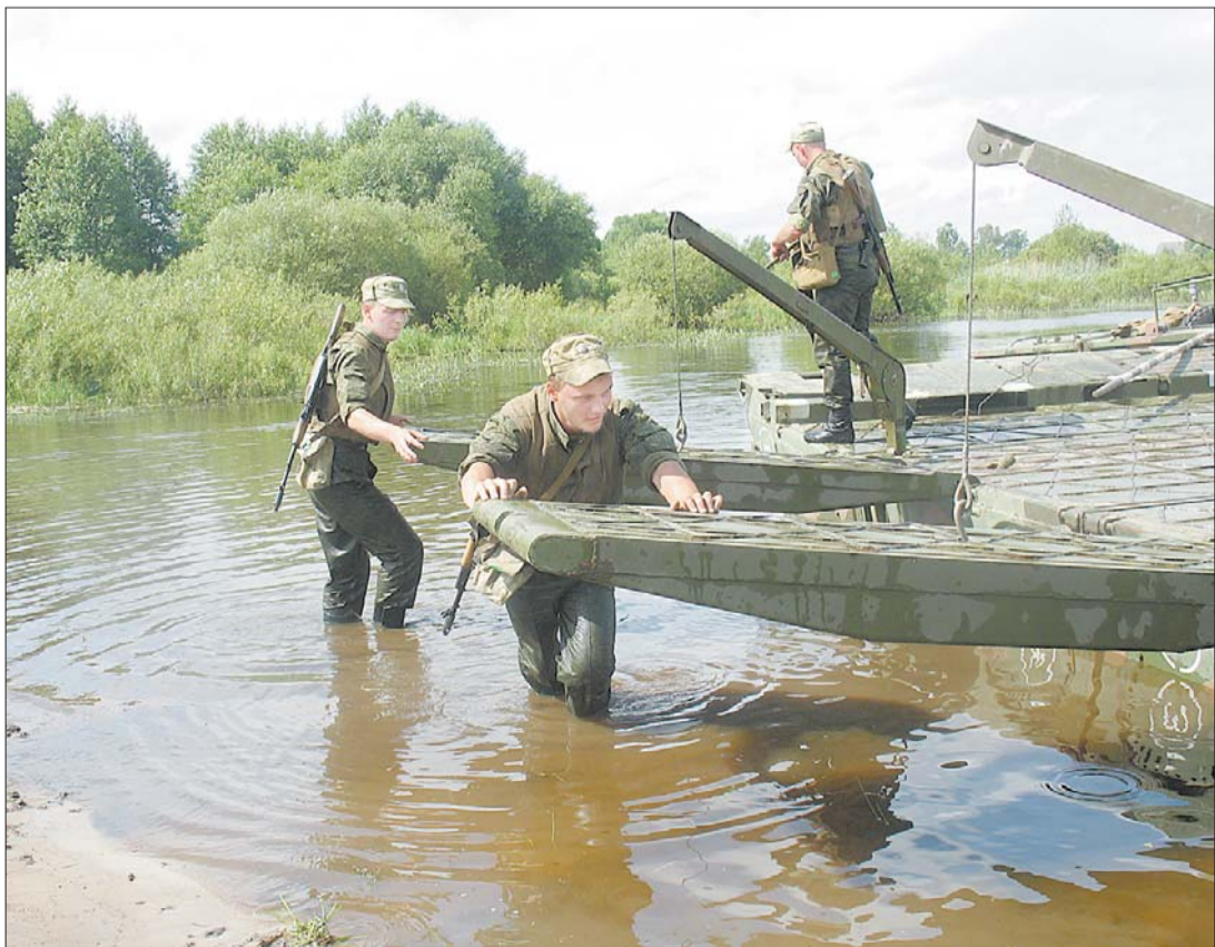
Ратныя будні воінаў 7-га інжынернага палка.