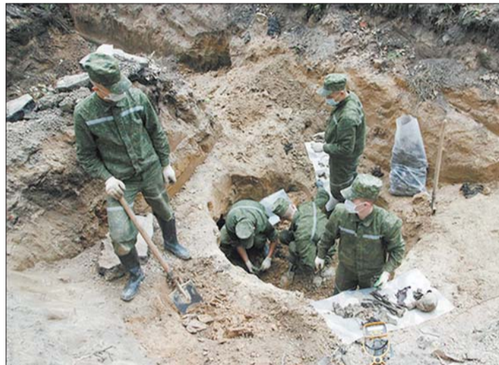
Падчас раскопак на вуліцы Мінна ў Мінску.

Над больш масавым пахаваннем працуюць вайскоўцы ў Гродне. Сюды, на тэрыторыю сучаснай войскавай часткі, давялося вярнуцца трэці раз. Эксгумаваўшы ў 2008 годзе больш за тысячу чалавек на месцы былога лагера ваеннапалонных часоў Вялікай Айчыннай вайны, прычым некалькі гадоў адкапалі яшчэ больш за сотню. Мясцовыя вайскоўцы вярнуліся і сёлета: відаць, натрапілі на чарговую яму з вялікай колькасцю загінулых.