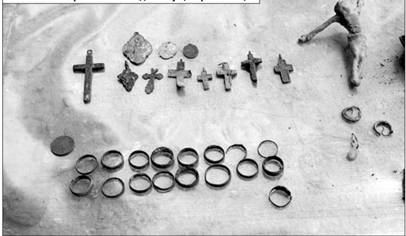
Такія знаходкі паднялі з зямлі вайскоўцы 52-га асобнага спецыялізаванага пошукавага батальёна Узброеных Сіл ледзь не ў цэнтры сталіцы.

2400 імёнаў. А ва ўзаемадзеянні з ваенкаматамі і мясцовай уладай — звыш 95 тысяч. Акрамя таго, у працягу года ўважлівасці памяці абаронцаў Айчыны і ахвяр вайны Узброеных Сіл вядзецца і ўлік ваініцкіх пахаванняў. Па іх звестках, сёння ў краіне налічваецца 7 тысяч 351 вайсковы пахаванне, сярэдні часоў Першай сусветнай вайны — 162. Магчыма, іх значна больш. У кнізе «Апошні прытулак салдата», якая гэтымі днямі ўбачыла свет у Выдавецкім доме «Звязда», змешчаны звесткі