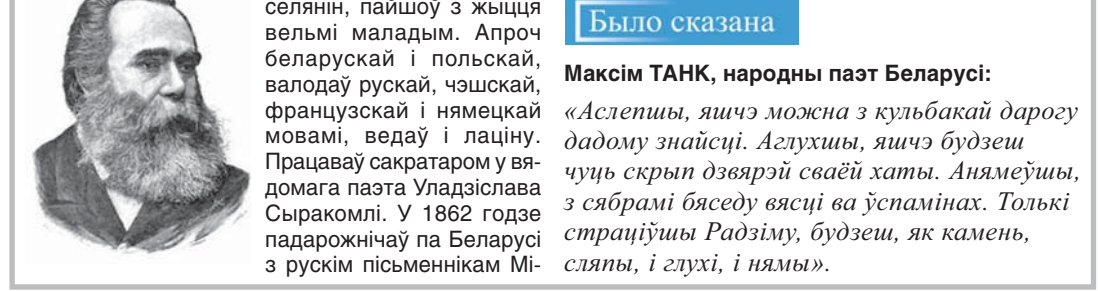
Максім ТАНК, народны паэт Беларусі: «Аслешы, яшчэ можна з кульбакі дарогу дадому знайсці. Глухіны, яшчэ будзеш чуць скрып дзвярэй сваёй хаты. Анямёўшчы, з сябрамі бядэду ясці ў ўспаминах. Толькі страціўшы Радзіму, будзеш, як камень, сляпы, і глухі, і нямы».

1944 год — 70 гадоў таму нарадзіўся (вёска Іванавічы Брабрунці, беларускі вучоны ў галіне механікі сельскай гаспадаркі, доктар тэхнічных навук (1999). У 1965 годзе скончыў БПІ.