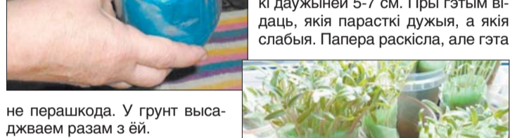
У ваду пажадана дабавіць некалькі кропель канцэнтрату для ўзмацнення росту. Пры з'яўленні ў расадзі двух сапраўдных лісточкаў разгортваем рулон, здымаем верхнюю палоску плёнкі, а там ляжачы парасткі як у плянкінах, карэнчыкі даўжынёй 5-7 см. Пры гэтым вадаць, якія парасткі дужыя, а якія слабыя. Папера расквісла, але гэта не перашкода. У грунт высаджваем разам з ёй.

Праз два тыдні ў шклянчык стаіць зялёны букет.