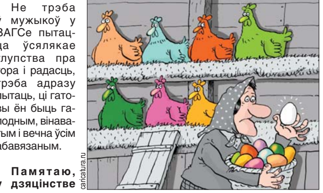
Памятаю, у дзяцінстве

О, хутка зноў пачнуцца гэтыя дзіўныя бацькоўскія сходы: уваход бясплатны, выхад — ад 100 да 300 тысяч.