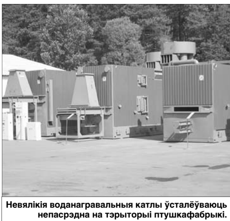
Невялікія воданагрэвальныя катлы ўсталююцца непасрэдна на тэрыторыі птушкафабрыкі.

Распрацаваная ім устаноўка можа выкарыстоўваць падсцілачны памёт вільготнасцю да 60%. Цеплавая энергія, атрыманая пры спальванні, ідзе на абгарванне і тэхналагічныя патрэбы птушкафабрыкі. Памёт не патра-