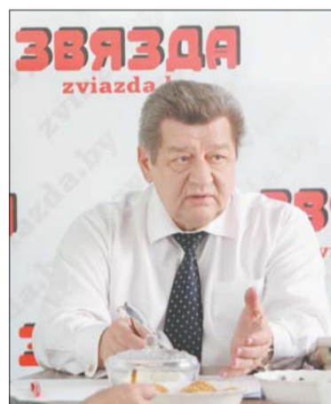
Васіль ЖАРКО, міністр аховы здароўя Рэспублікі Беларусь

Беларусь у XXI стагоддзі — гэта краіна шматнацыянальная і шматканфесійная. На чым грунтуецца мірнае суіснаванне прадстаўнікоў розных народаў, якім чынам дзяржава забяспечвае рэгуляванне ў гэтай сферы, як працяляе сябе асабліва беларускі менталітэт і што значыць быць грамадзянінам Беларусі?