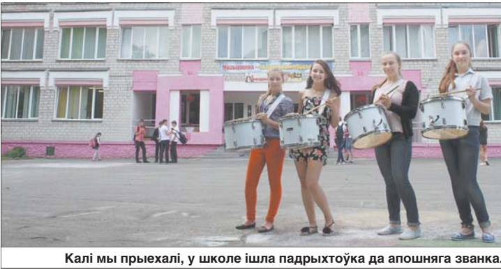
Калі мы прыехалі, у школе ішла падрыхтоўка да апошняга звянка.

Сваімі сіламі ў школе робяць рамонт, праектуюць мабіль, распісваюць сцены... Аказваецца, няма нічога немагчымага, галоўнае — быць сапраўды захопленым сваёй справай.