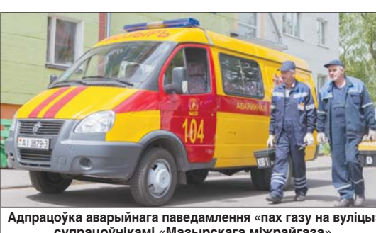
Адпрацоўка аварыйнага паведамлення «пах газу на вуліцы» супрацоўнікамі «Мазырскага мікрагаза».

Тым часам мы падыходзім да аднаго з газарэгуляторных пунктаў, які знаходзіцца непасрэдна на тэрыторыі прадпрыемства.